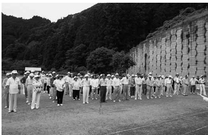
ソフトバレーボール交流大会 成績表

上位6チームが9月に開催される「奈良県老人クラブ連合会ゲートボール大会」の出場権を手にしませんが、残念ながら本村のチームは県大会への切符を手にする事は出来ませんでした。 また、大会開催にあたり本村老人クラブ連合会役員の皆様方には、ゲートボール場の整備にご協力を頂き、ありがとうございます。来年は県大会への出場を期待いたします。