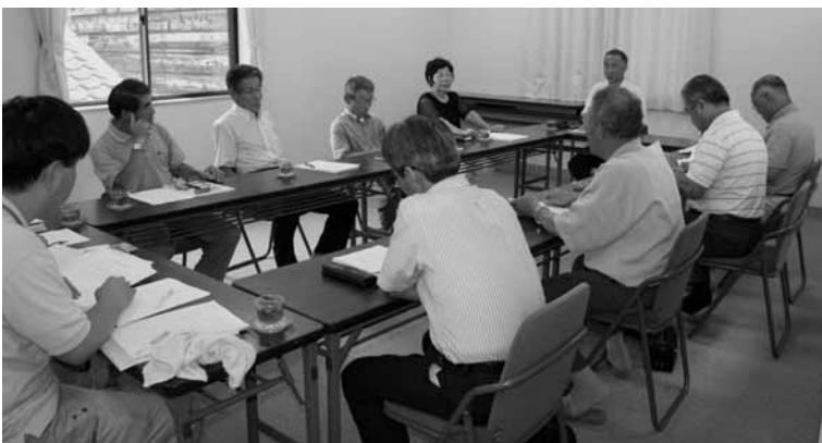
第1回農業委員会の様子